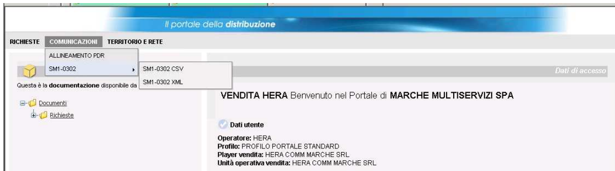
Figura 5: Percorso per scaricare flusso 0302